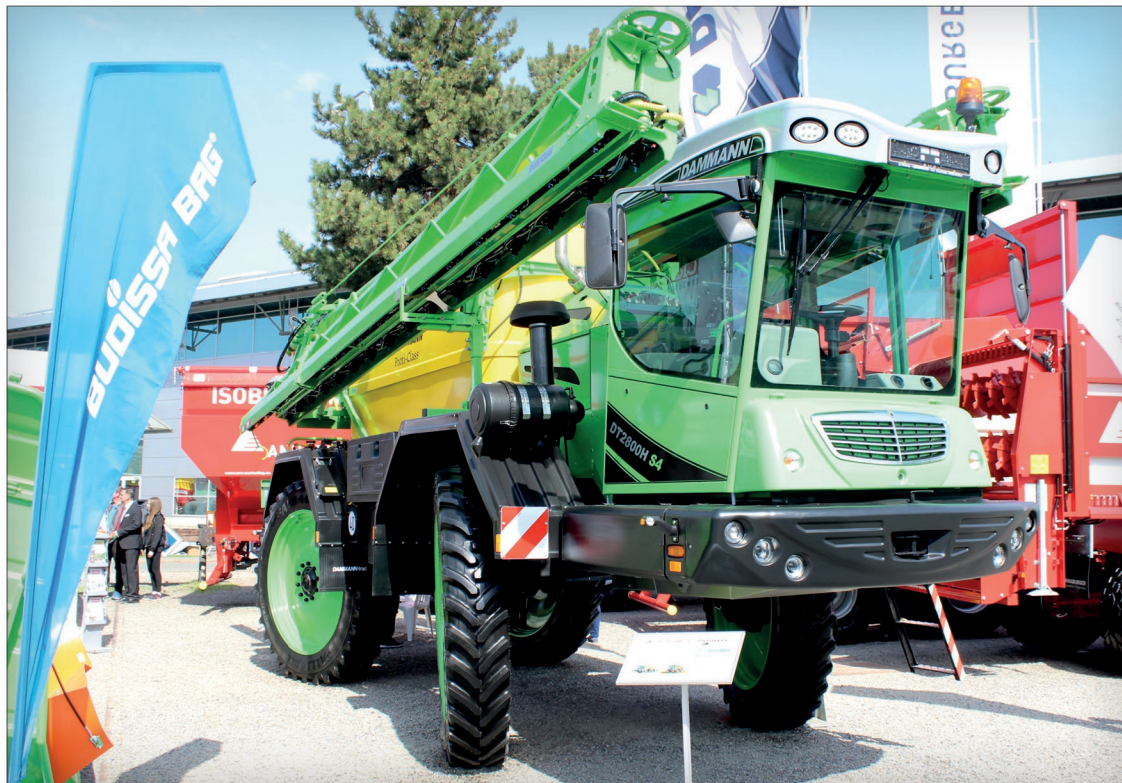
Samojízdný postřikovač Dammann DT 2800H S4 patří ke špičce ve své třídě

trazvuková čidla, vypínání jednotlivých postřikovacích sekcí, HD Night Lux systém pro práci v noci, včetně ovládní osvětlení jednotlivých postřikových kuželů a další. Samojízdné postřikovače Dammann jsou vlastně výměnné systémy, výrobce umožňuje zaměnit postřikovou nástavbu za rozmetadlo minerálních hnojiv.