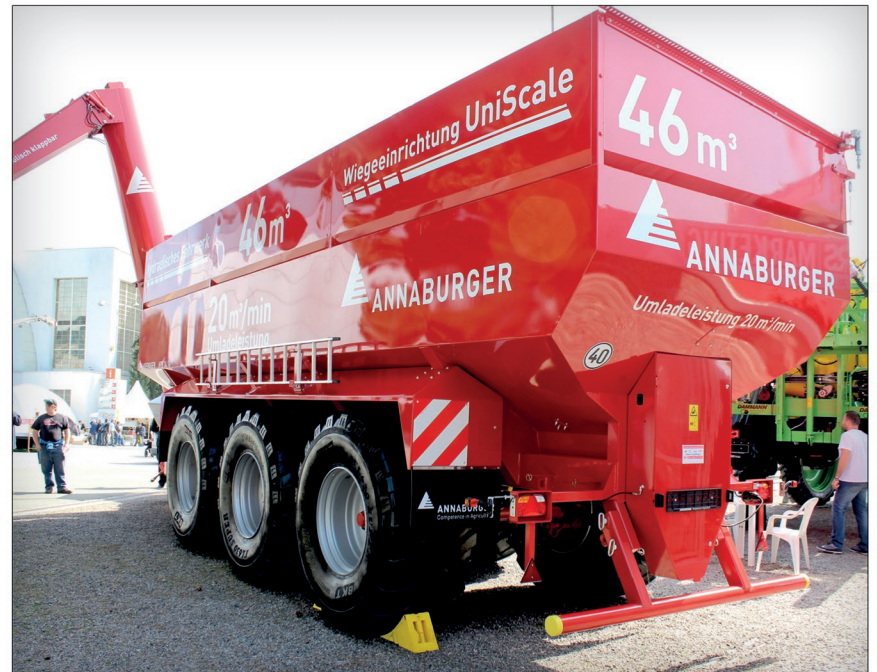
Největší překládací vůz v nabídce firmy Annaburger, model HTS 34.16 s korbou o objemu 46 m 3

mojízdný postřikovač Dammann DT 2800H S4 poháněný motorem Mercedes Benz o výkonu 285 k. S nádrží o objemu 7000 l (výrobce nabízí objemy 4000; 5000; 6000 a 7000 l) patří mezi největší samojízdné postřikovače na trhu. Vzduchem odpružený podvozek se světlou výškou 1,1 m může mít jednu nebo obě nápravy říditelné. Rozchod kol u vystaveného stroje činí 2,25 m. Kloubově dělená ramena o pracovním záběru 18/36 m (vyrábí se od 24 do 42 m) byla rozdělena na 18 sekcí. Do velmi bohaté výbavy stroje patří celá řada systémů – DGPS přijímač Glonnas AG Star, ul-